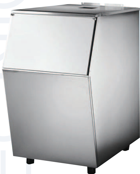
*Fotografía de referencia